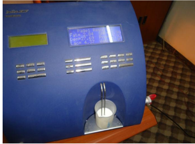
الشكل (2) جهاز تحليل مكونات الحليب Julie-Z7

- التحليل الإحصائي: استعملت طريقة الأتمودج الخطي العام (General Linear Model-GLM) ضمن البرنامج الإحصائي SAS (6) لدراسة تأثير نوع خضاب الدم في الصفات المختلفة وفق (النماذج الرياضية أدناه)، وقورنت الفروق المعنوية بين المتوسطات بعد أن تم تطبيق طريقة متوسط المربعات الصغرى، كما أستعمل اختبار مربع كاي (Chi-square) ضمن البرنامج الإحصائي نفسه لمقارنة الاختلافات بين نسب توزيع طرز خضاب الدم في العينة المدروسة.