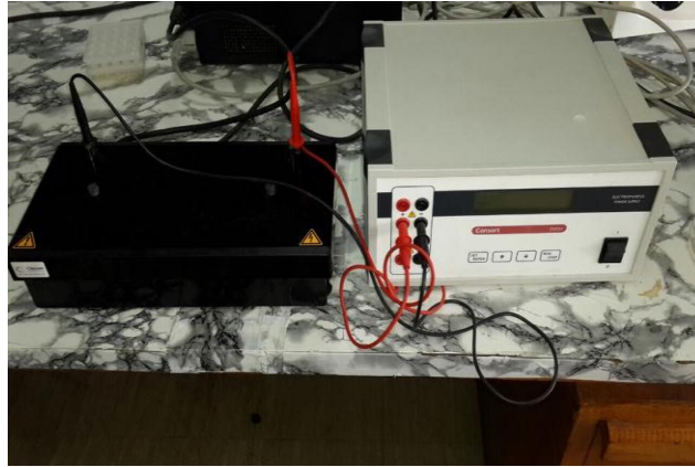
الشكل (1) جهاز الترحيل الكهربائي

- عملية جمع نماذج الدم: تم جمع عينات الدم من 50 نعجة، عن طريق الوريد الوداجي للحيوانات لتحديد طراز الهيموغلوبين وعلاقتها بأداء النعاج والحملان. استخدمت طريقة الترحيل الكهربائي وباستعمال ورق السليلوز (Electrophoresis cellulose acetate) لتحديد طراز خضاب الدم المصنع من شركة Cleaver Scientific Ltd البريطانية ومزود ببرنامج تطبيقي Software وحسب ما جاء به (5).