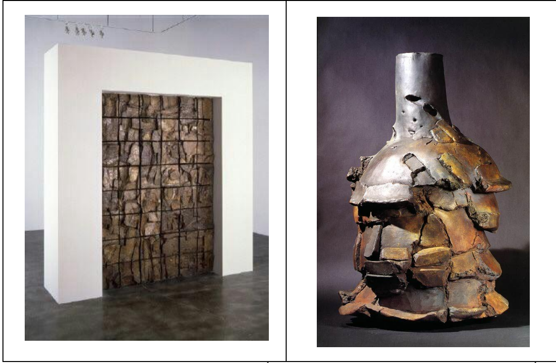
من أعمال الفنان الخزاف ( Peter Voulkos ) من أعمال الفنان الخزاف ( John Mason ) اللوحة (١) : الملمس الارتجالي