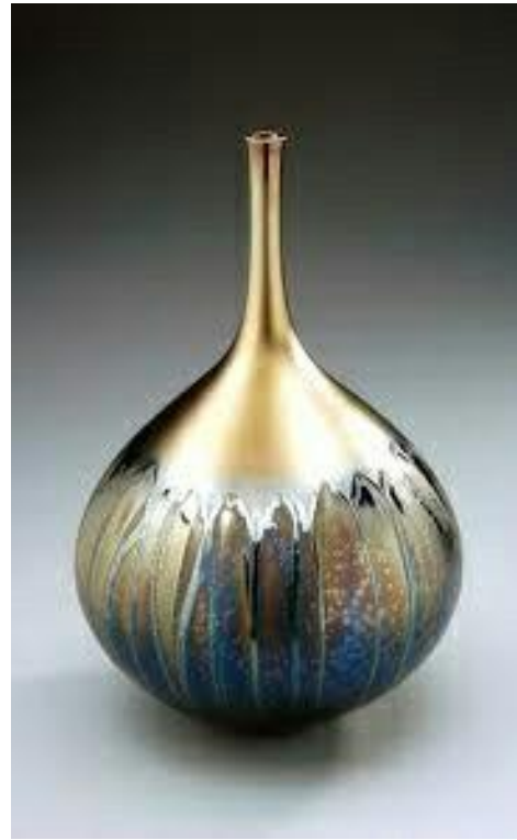
اللوح (١٢) : الملمس المعدني