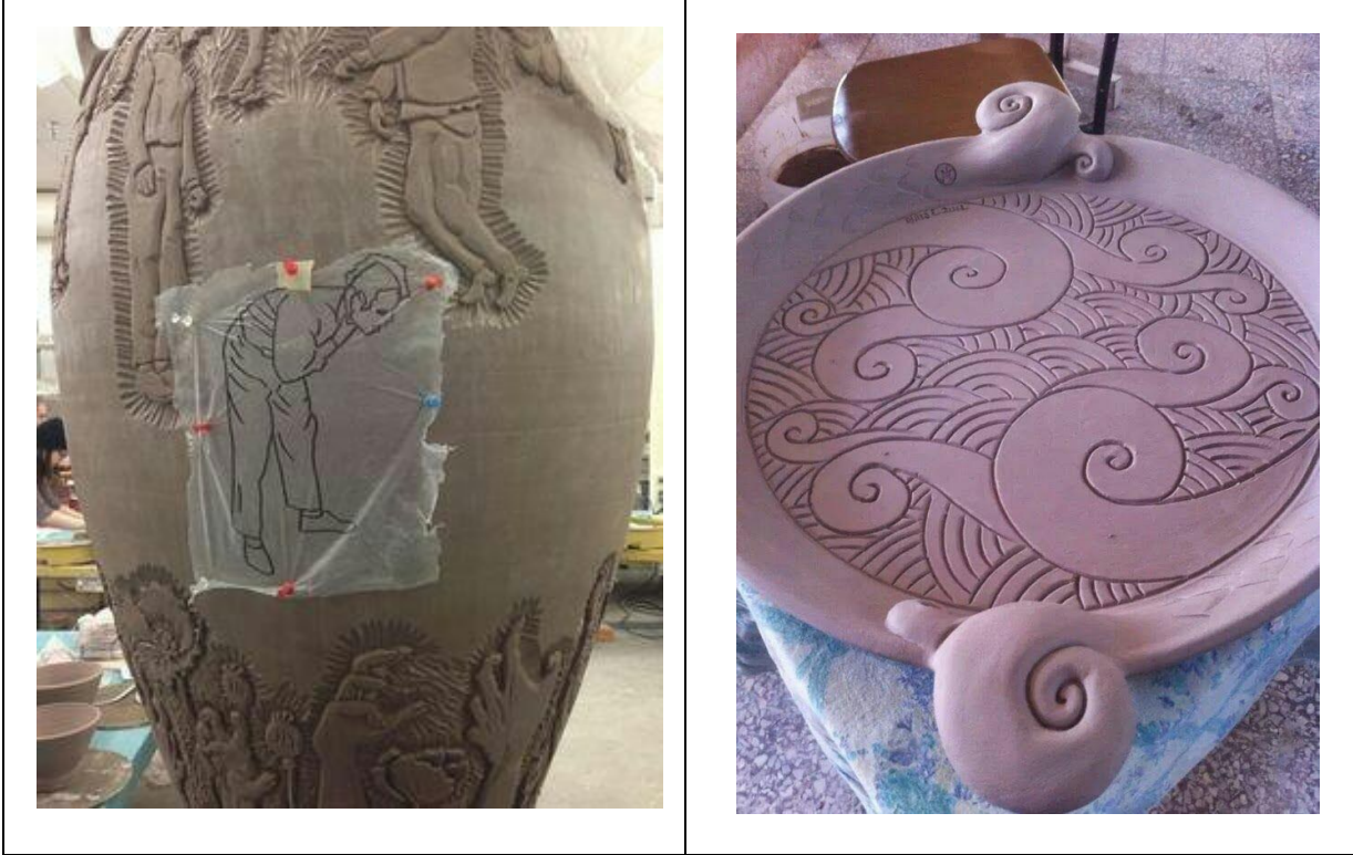
اللوحة (٥) : الملمس المقيد