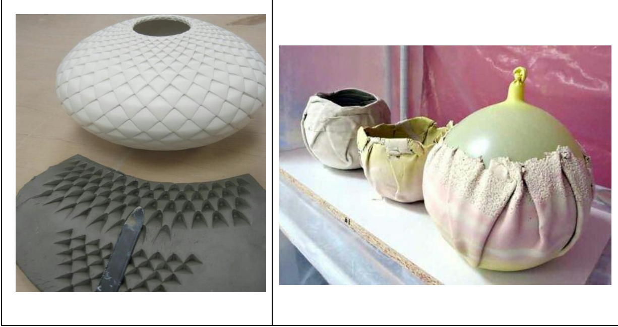
اللوحة (٧) : الملمس المقولب