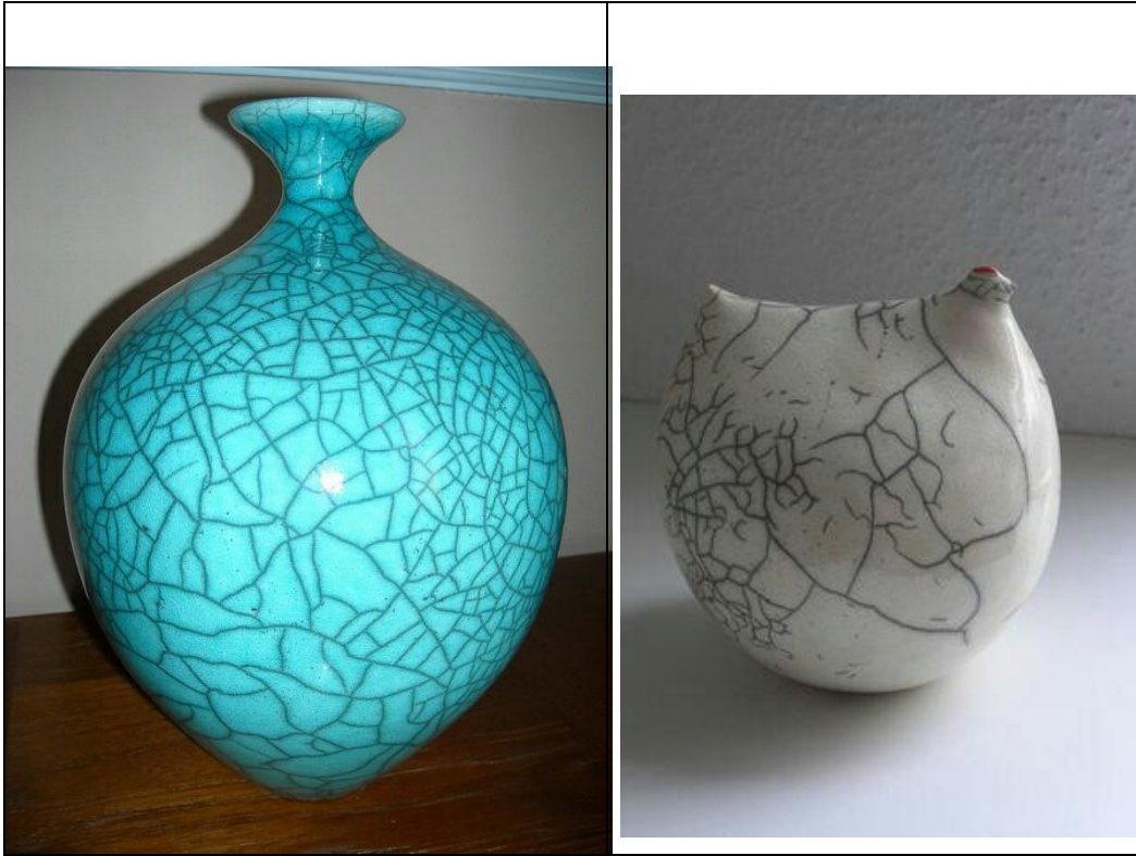
اللوحة (٨) : الملمس المتصدع