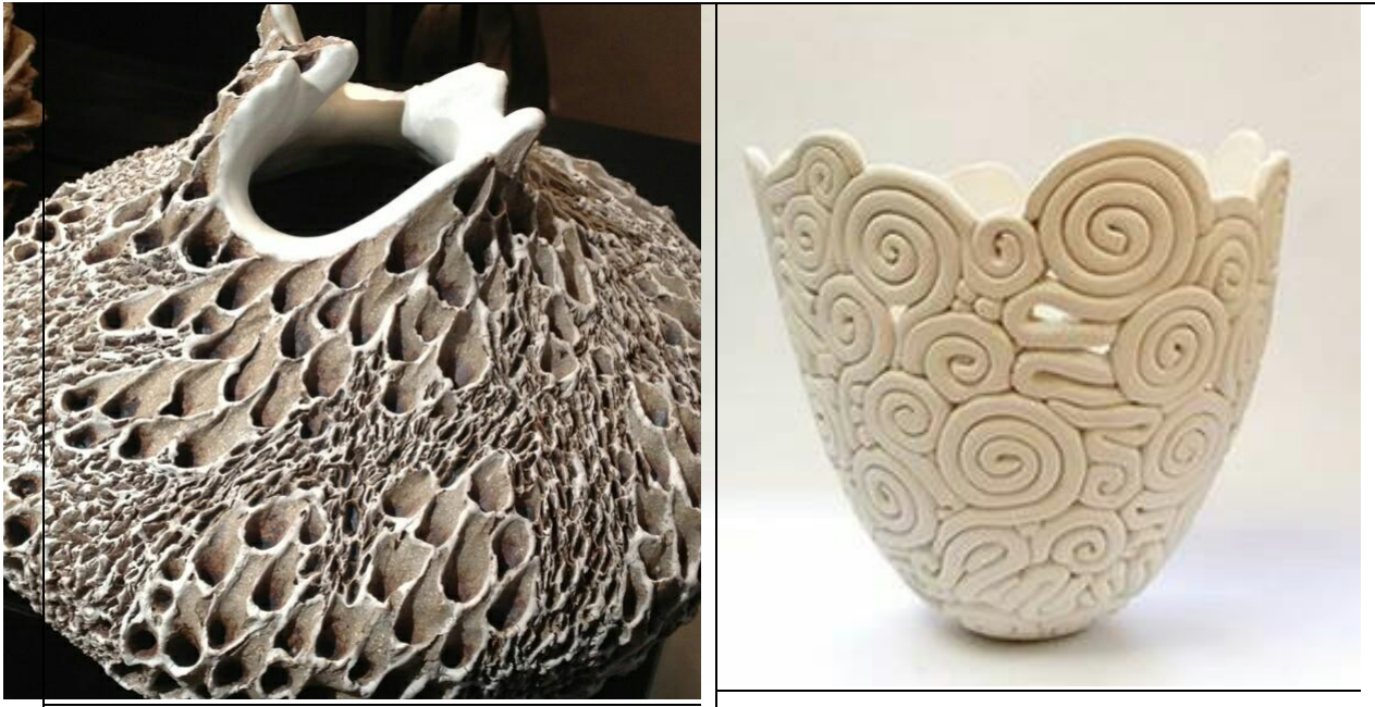
اللوحة (٤) : الملمس الكلي