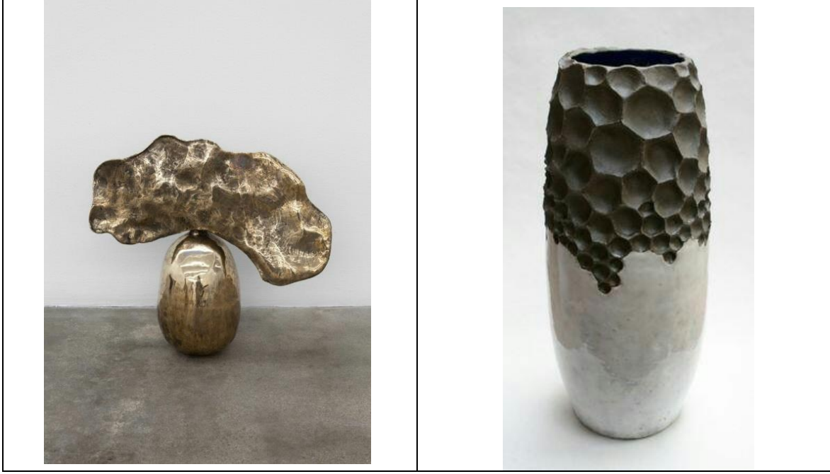
اللوحة (٣) : ملمس الاستبدال