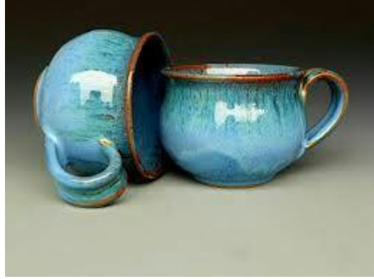
اللوح (١١) : الملمس الشديد للمعان