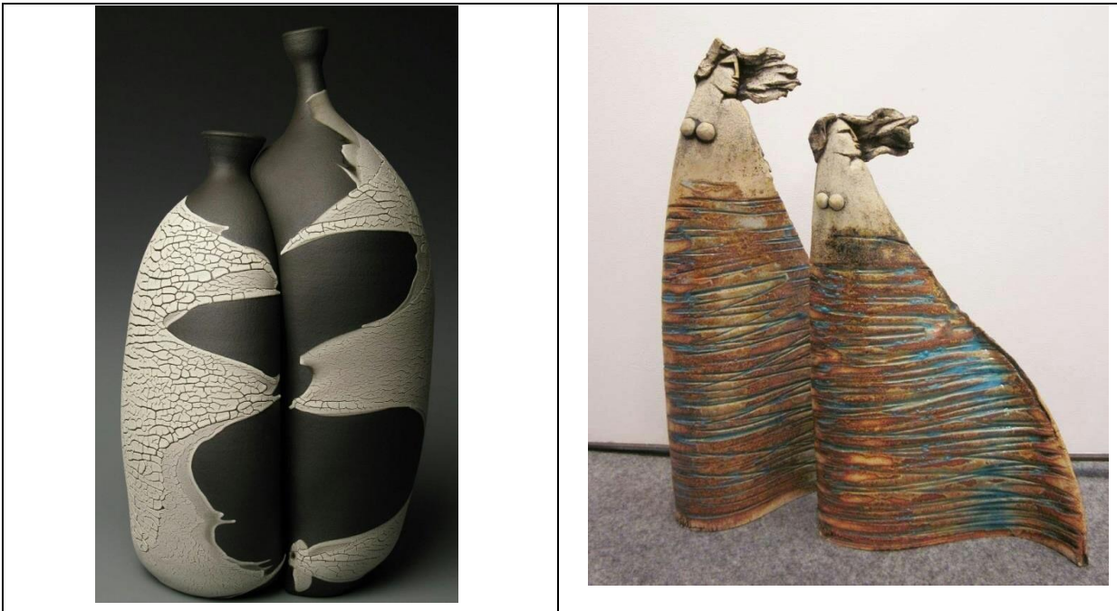
اللوحة (٦) : الملمس المتعاكس