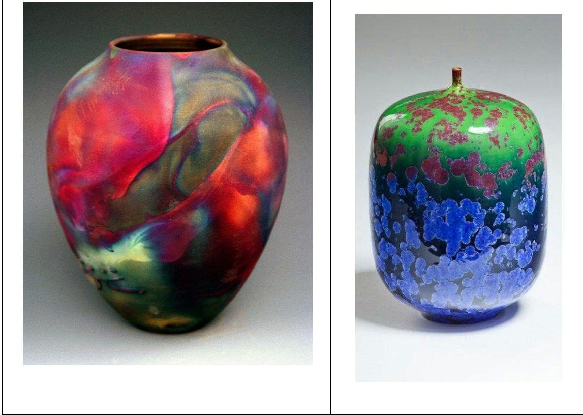
اللوحة (٩) : ملمس التقنيات الخاصة