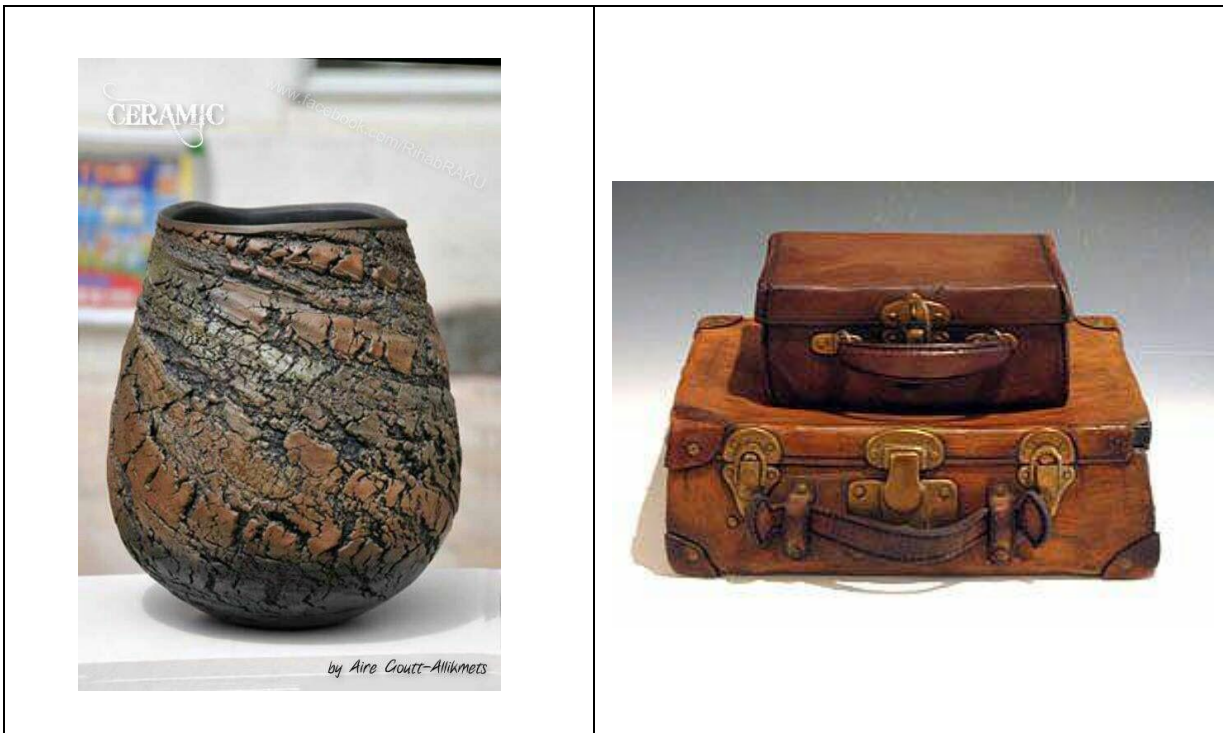
اللوحة (١٠) : ملمس الواقع المفرط