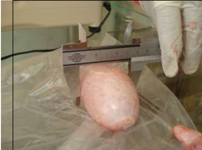
الشكل 4. قياس سمك الخصية

أستعمل التصميم العشوائي الكامل (CRD) مع عدم تساوي المكررات لدراسة تأثير مواسم السنة في الصفات المختلفة على الخصية والبربخ، وقورنت الفروق المعنوية بين المتوسطات باختبار Duncan (8) متعدد الحدود ، وأستعمل البرنامج SAS (9) في التحليل الإحصائي.