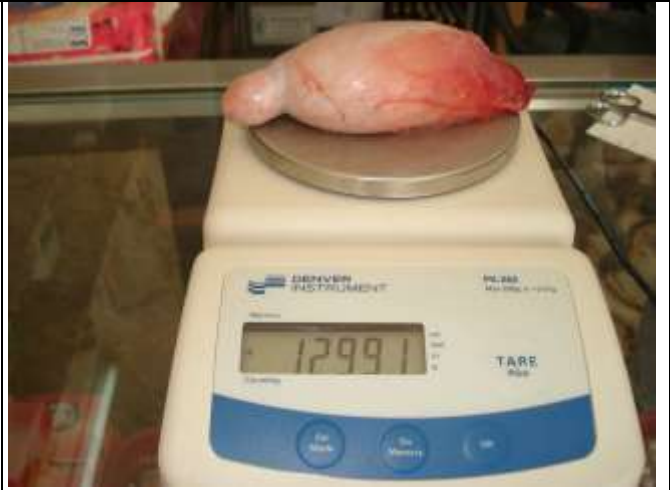
الشكل 1. قياس وزن الخصية