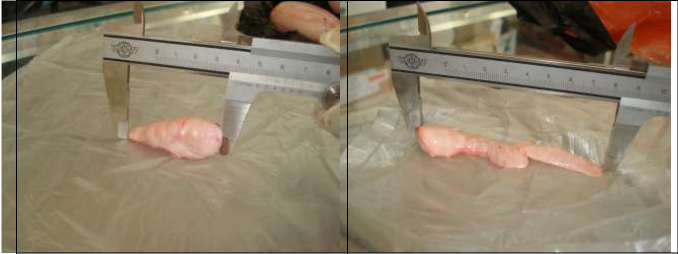
الشكل 10. قياس طول ذيل البربخ