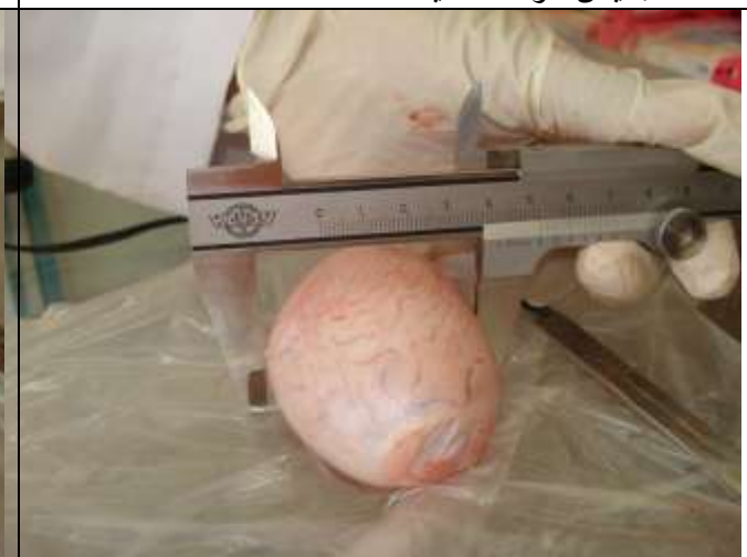
الشكل 6. قياس عرض رأس البربخ