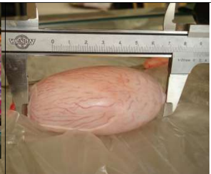
الشكل 5. قياس حجم الخصية