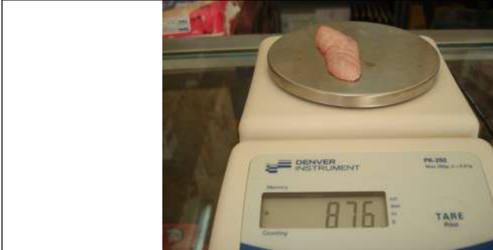
الشكل 11. قياس وزن رأس البربخ