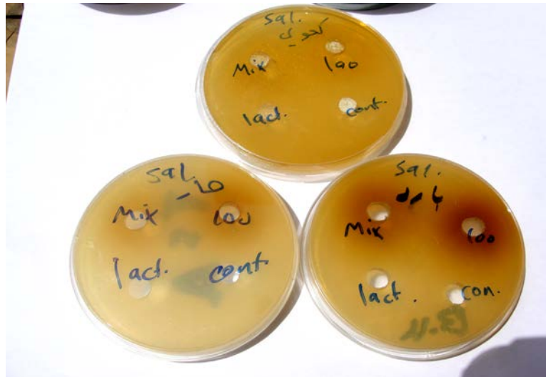
شكل (3) يوضح أطباق لجرثومة Salmonella typhimurium وتأثير المستخلصات الخام لنبات المرير